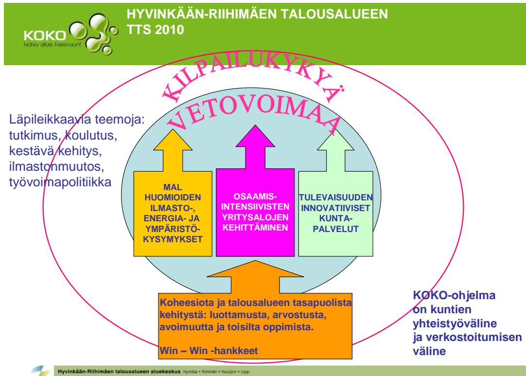
Kuva 1: Hyvinkään-Riihimäen talousalueen koheesio- ja kilpailukykyohjelma

Seuraavassa kuviossa on kuvattu Hyvinkään-Riihimäen talousalueen koheesio- ja kilpailukykyohjelman kärkihankkeet ja ohjelmaa läpileikkaavat teemat ja ohjelman arvot (kuva 1).